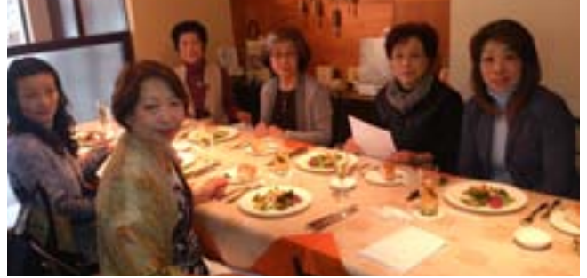
美味しそうな料理を前に