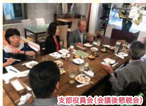
支部役員会(会議後懇親会)

支部毎に様々な活動をしています。第12支部では、研修会や他支部と企画して、バス旅行や交流会を開催しています。会員はもちろん、非会員の方も参加できる催しもございます。