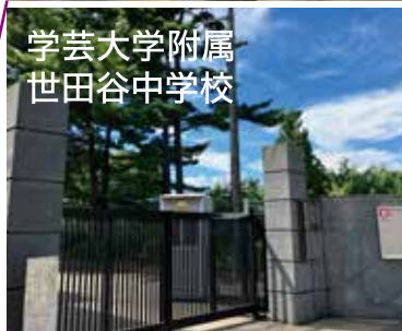
学芸大学附属 世田谷中学校