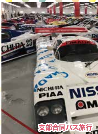
支部合同バス旅行