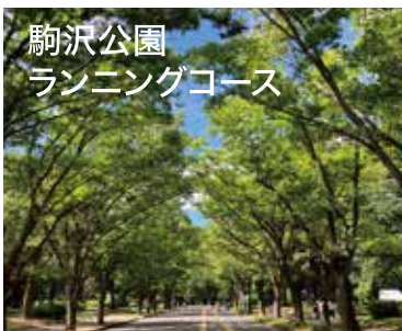
駒沢公園 ランニングコース