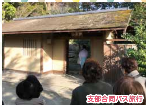
支部合同バス旅行