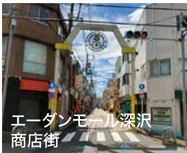
エーダンモール深沢 商店街