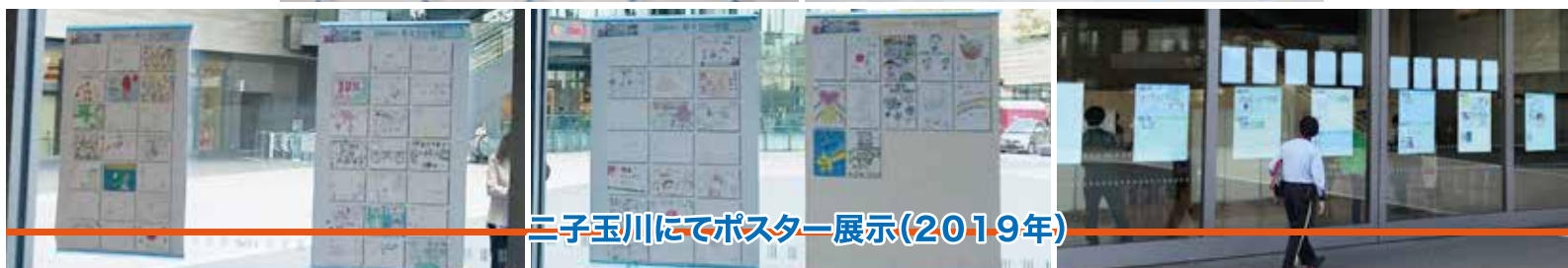
二子玉川にてポスター展示(2019年)