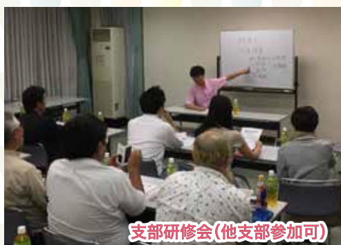
支部研修会(他支部参加可)