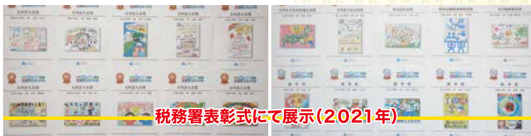
税務署表彰式にて展示(2021年)