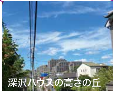
深沢ハウスの高さの丘