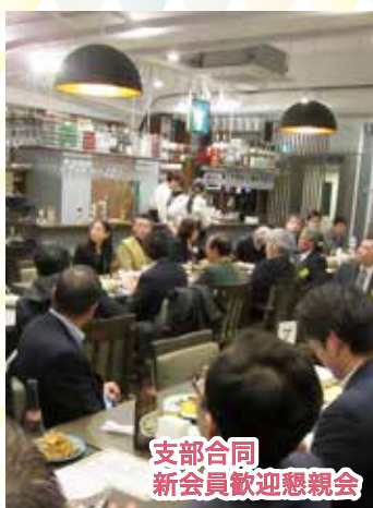
支部合同 新会員歓迎懇親会