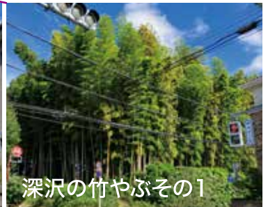
深沢の竹やぶその1