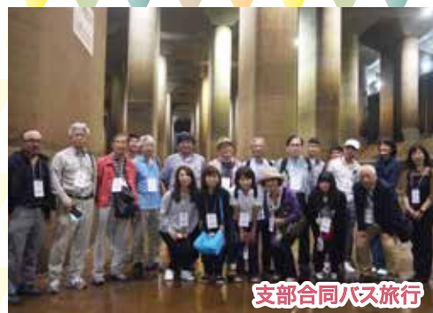
支部合同バス旅行