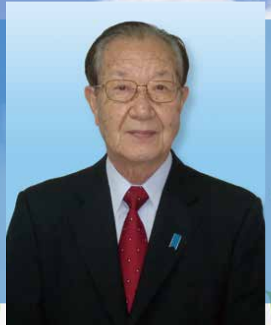
北朝鮮による拉致被害者家族連絡会 代表